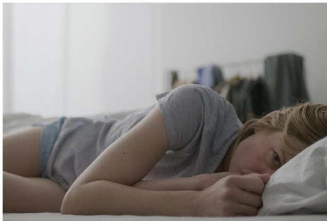
Στιγμιότυπο από την ταινία «24 Εβδομάδες» της Anne Zohra Berrach

Ευτυχισμένη σύζυγος και μητέρα ενός 8χρονου αγοριού, η Άστριντ ανακαλύπτει πως είναι ξανά έγκυος. Γεμάτη χαρά ξαναζεί την καινούργια της εγκυμοσύνη ώσπου στον έκτο μήνα κύησης έρχεται αντιμέτωπη με μια σκληρή πραγματικότητα. Κατά τη διάρκεια ενός ελέγχου ρουτίνας, ανακαλύπτουν ότι το παιδί τους είναι βαριά άρρωστο. Η Άστριντ είναι αντιμέτωπη με ένα φοβερό δίλημμα που σύμφωνα με τον γερμανικό νόμο είναι δική της ευθύνη η τελική επιλογή. Μια κινηματογραφική πρόταση που αναδεικνύει τις εύθραυστες διαστάσεις ανάμεσα στην ιατρική και τη μητρότητα.