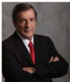
Georgios Kaminis Mayor of Athens